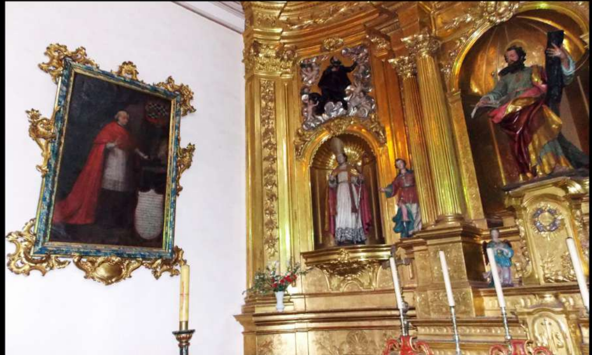
Martín de Elizacoechea, obispo de Michoacán en 1754

¿Es verdad que la iglesia de AZPILKUETA se construyó con el donativo que envió un obispo baztanés desde Méjico?