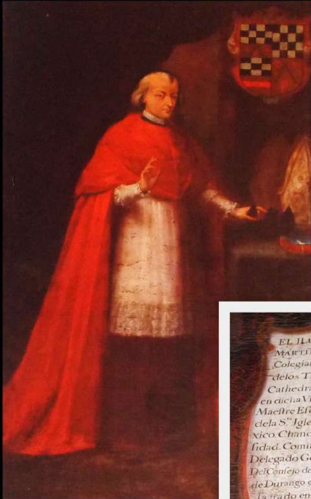
Martín Elizacoechea Michoacango apezpikua 1754ean

Egia al da AZPILIKUETAKO eliza eraiki zela baztango apezpiku batek Mejikotik bidalitako diru laguntzari esker?