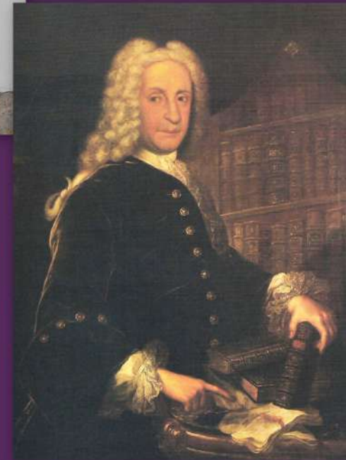
Juan de Goyeneche