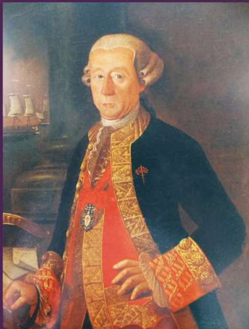
Miguel José Gastón de Iriarte Elizacochea