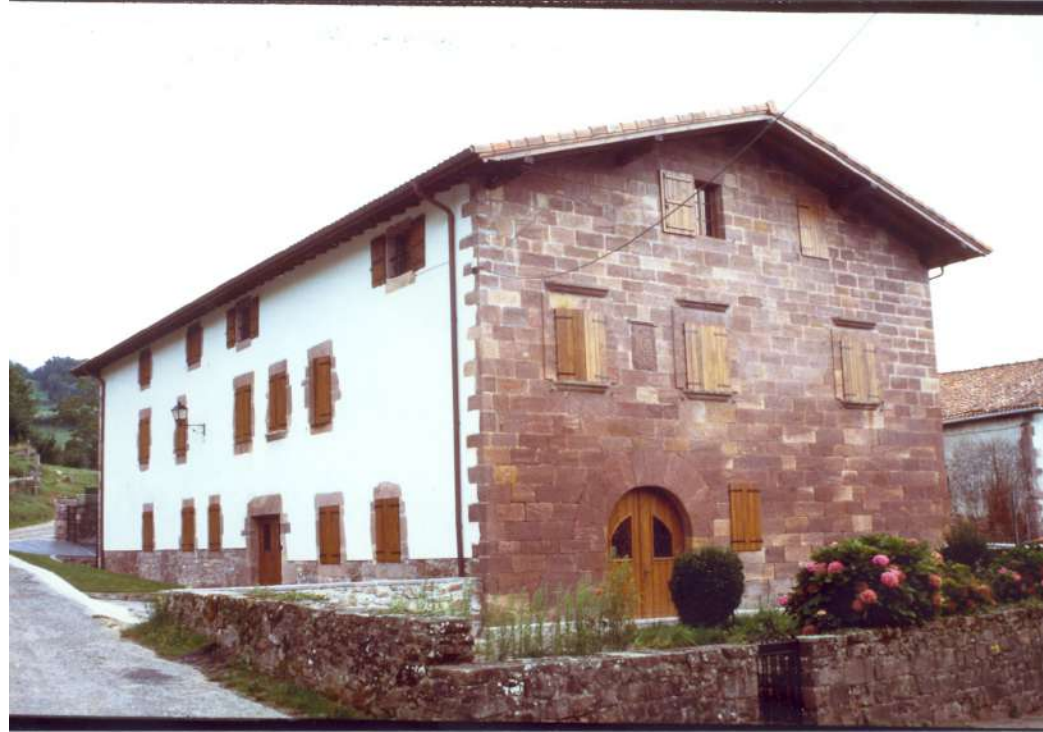
Palacio de Arrechea, de Maya.